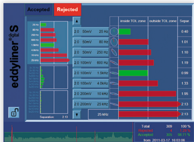
Resultados de test mostrados en gráfico de barras