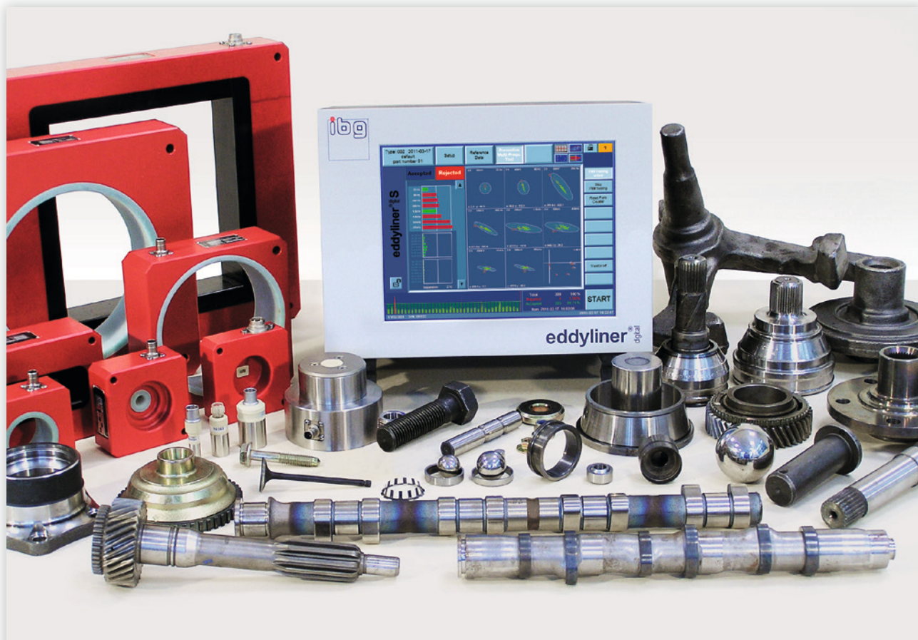
Selección de componentes, aplicación resuelta por tecnología IBG

El Eddyliner Digital S se distingue por su diseño compacto y un canal para aplicaciones de estructura con una bobina y una posición combinando la conocida fiabilidad de inspección de ibg con su facilidad de operación. La interfaz ergonómica permite una correcta y sencilla operatividad via pantalla táctil. Todas las funciones y resultados de las pruebas son capturadas en un solo vistazo.