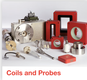
Coils and Probes