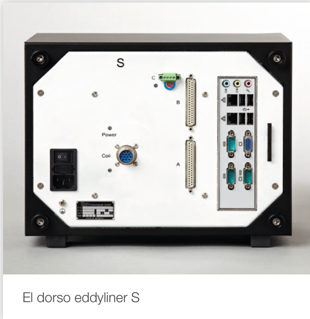
El dorso eddyliner S