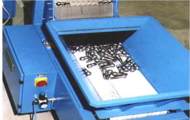
The belt bunker can hold up to 250kg of test parts and forwards them to the charging box of the step feeder as required.