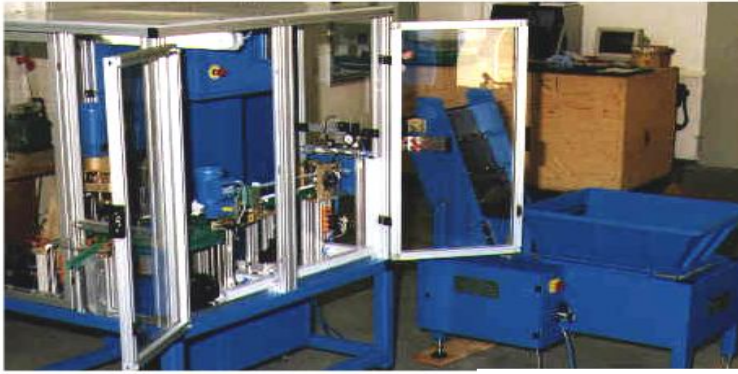
The step feeder smoothly forwards ball pins to a crack detection system.